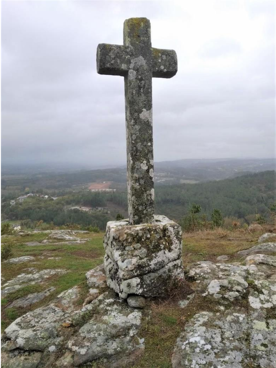
FOTO 24. VILAFIZ. CRUZ DO PICO DA CRUZ