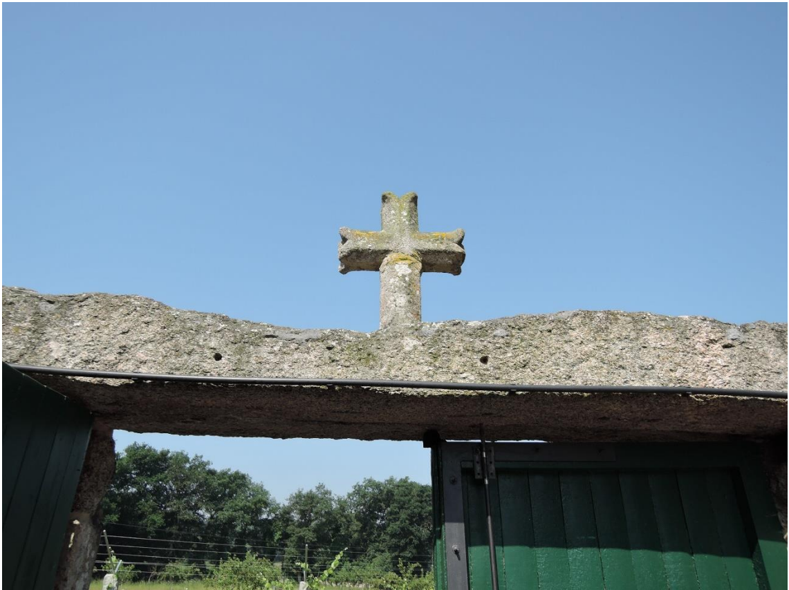
FOTO 15. NEIRA. CRUZ DE ACCESO Á FINCA DO PAZO.