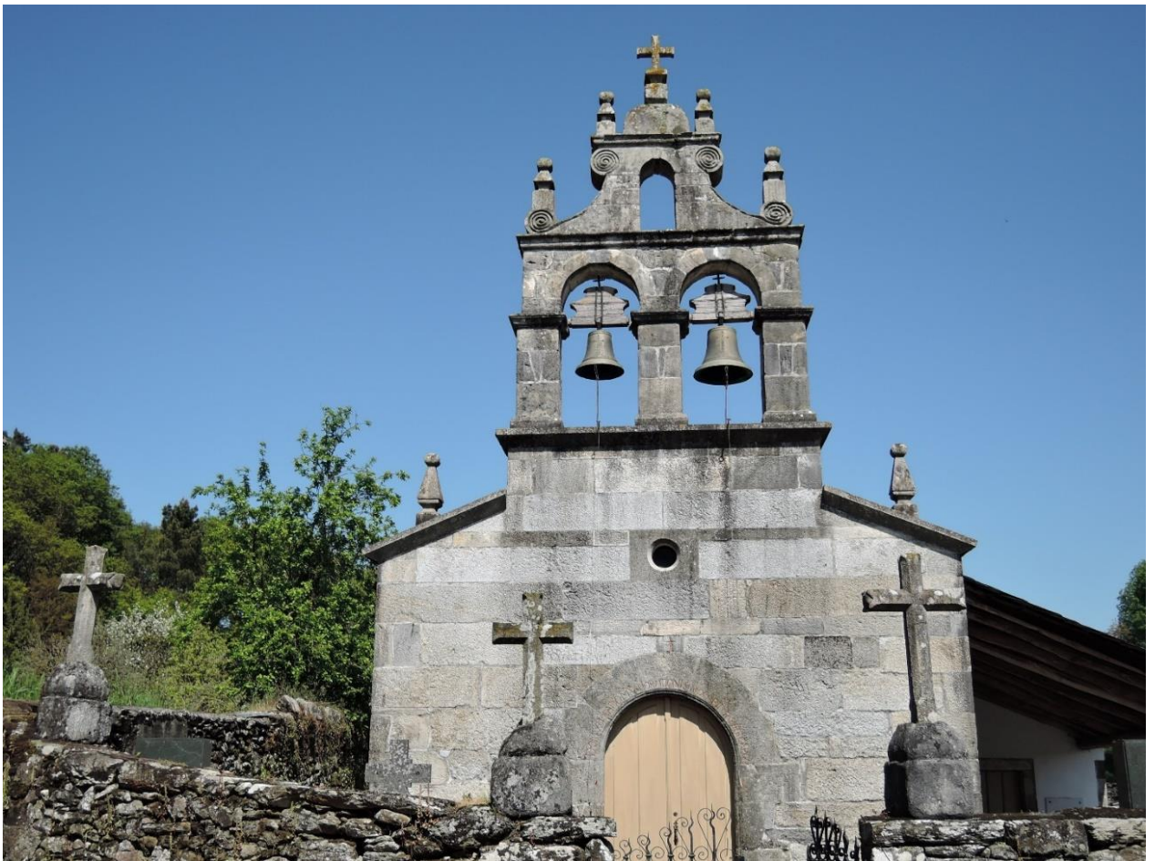
FOTO 3. SANTA MARIA DE GONDRAME. RESTOS DUN VIACRUCIS.