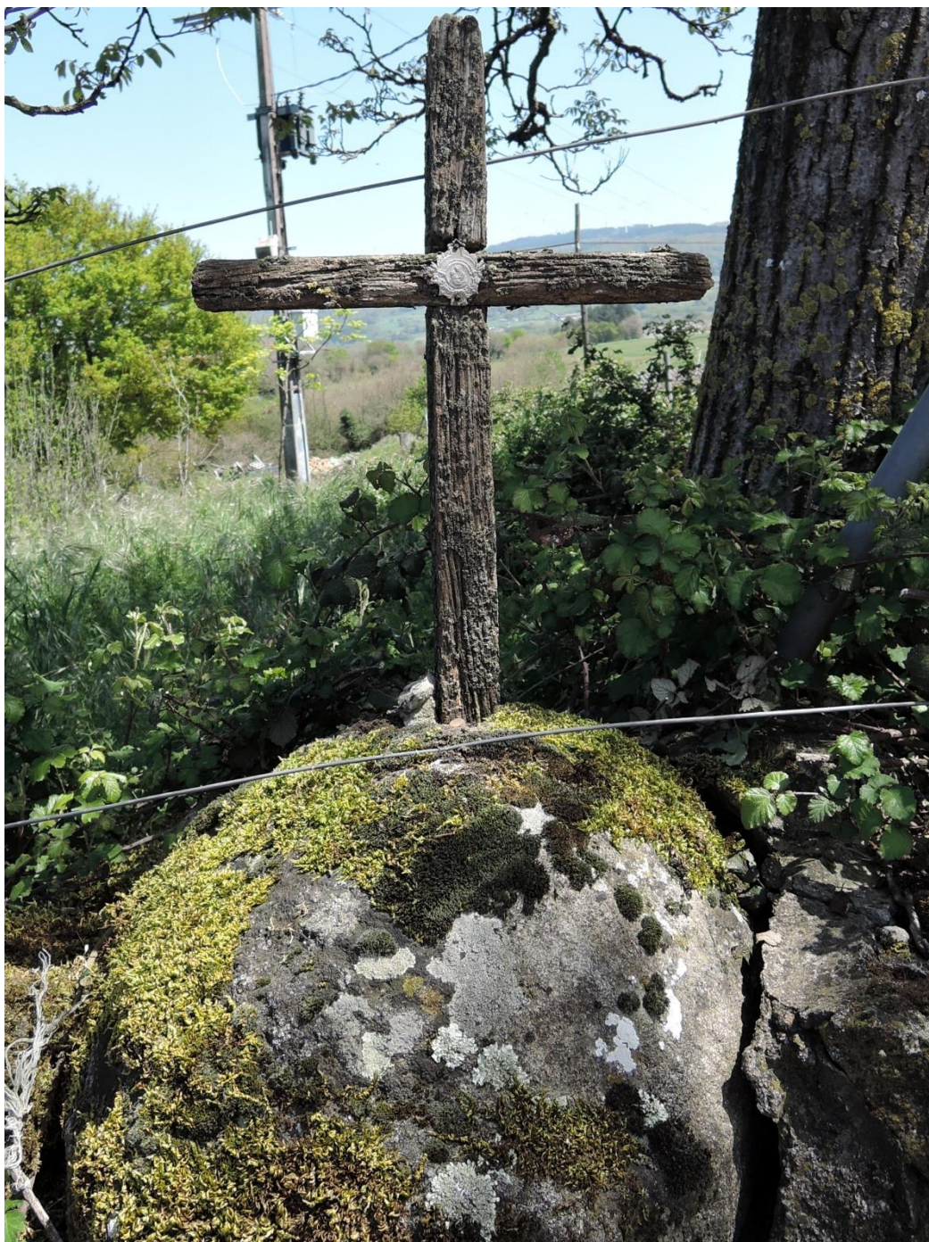
FOTO 2. ADAI. CRUZ DE BELEIGÁN.