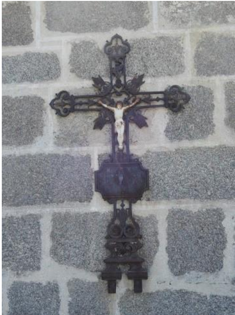
FOTO 12. MOSCÁN. CRUZ FACHADA DA IGREXA