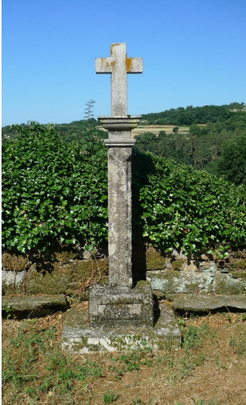
FOTO 21. SAN ANDRÉ DA RIBEIRA. CRUCEIRO DA DEREITA.