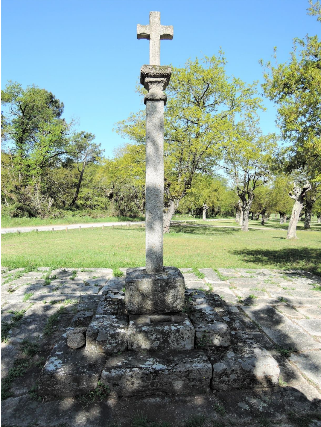
FOTO 26. VILARMOSTEIRO. CRUCEIRO DO CAMPO DA FEIRA.