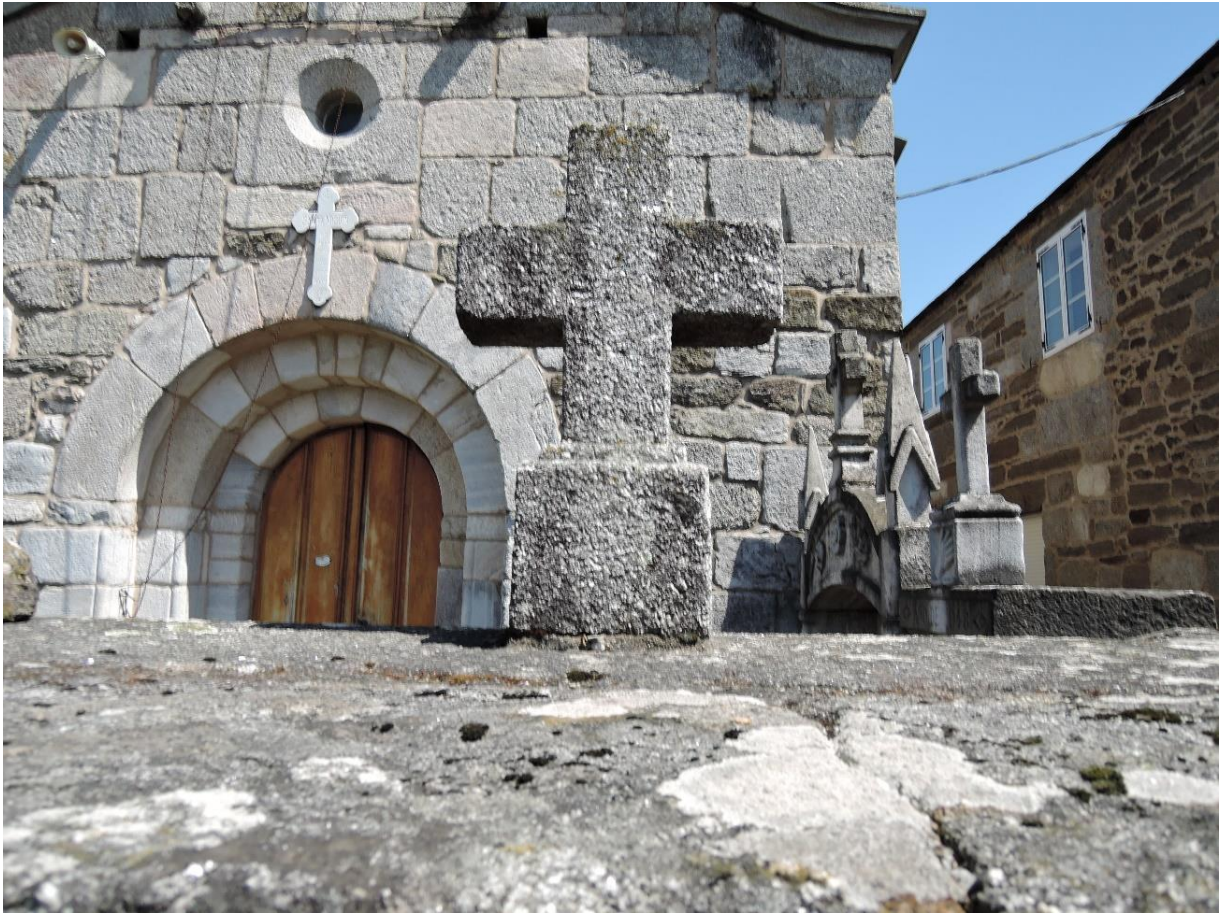
FOTO 7. SAN VICENTE DE GONDROME. RESTOS DUN VIACRUCIS