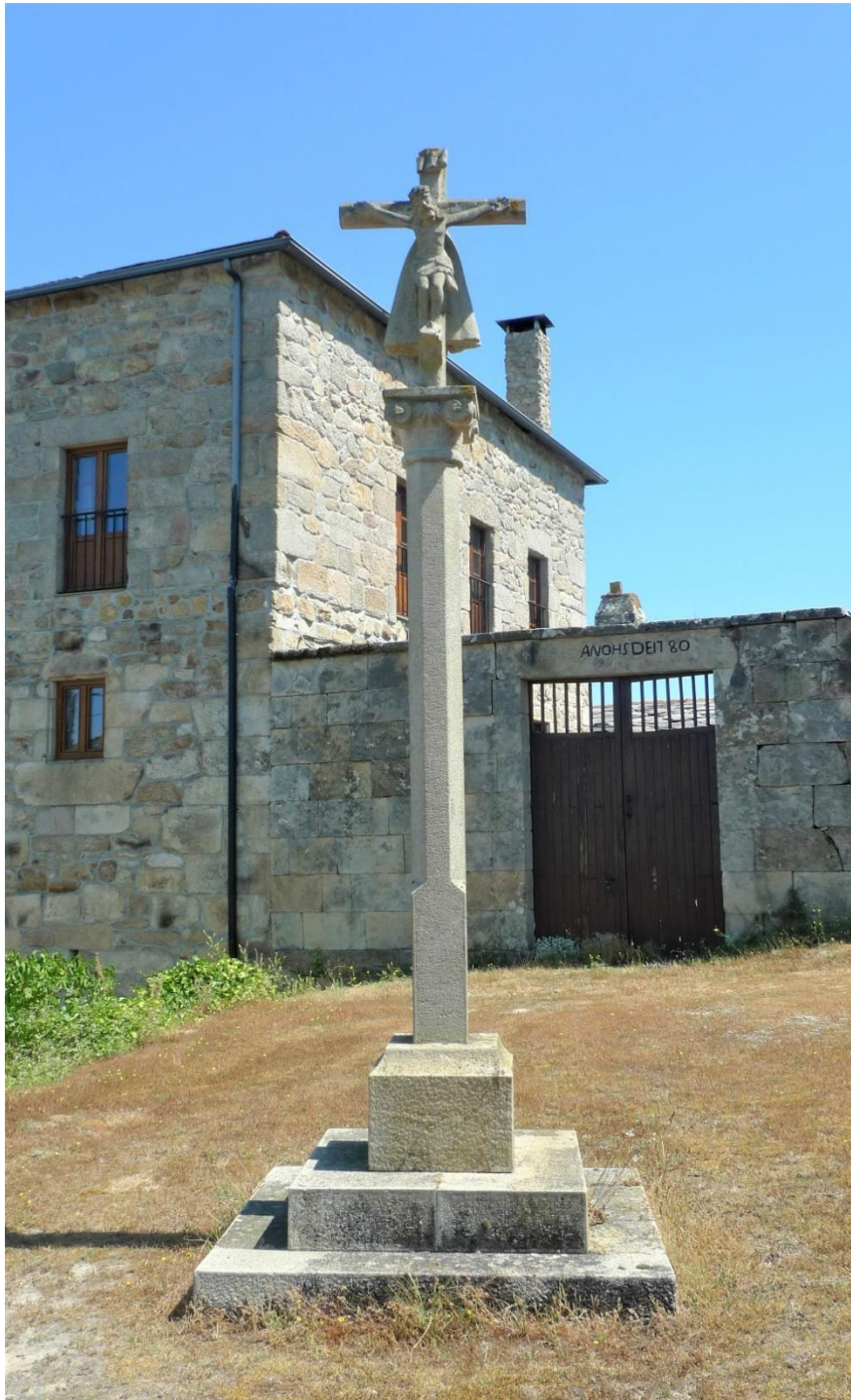
FOTO 9. MOSCÁN. ALBAREDO. CRUCEIRO DAS HORAS PERDIDAS.