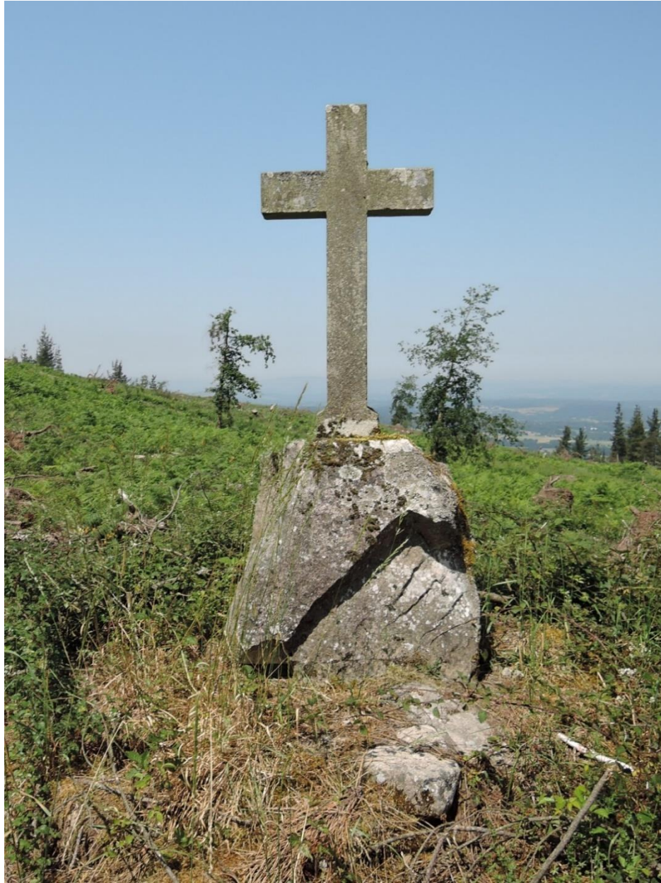
FOTO 18. SA. CRUZ DA AGUIEIRA.