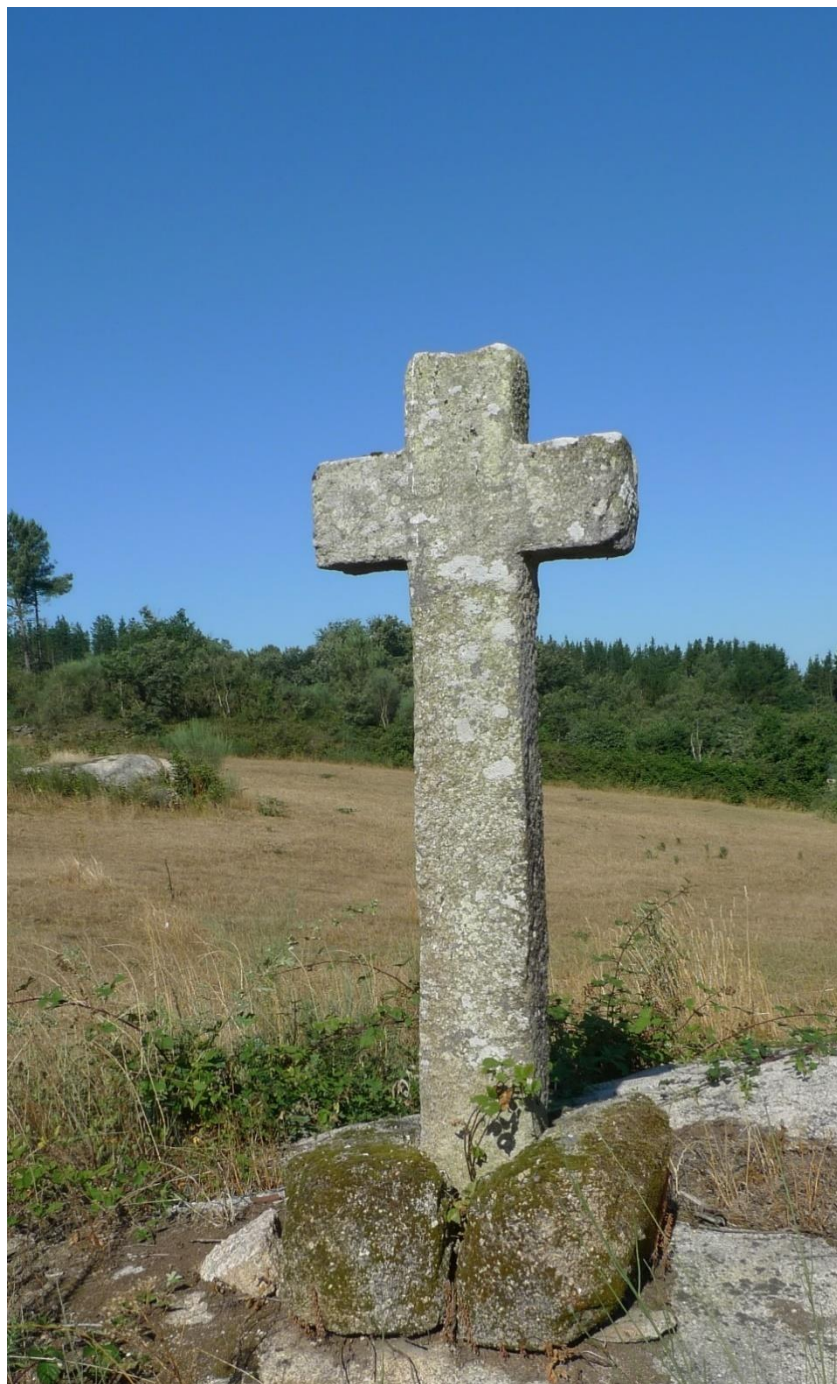
FOTO 8. CRUZ DE RECONCO