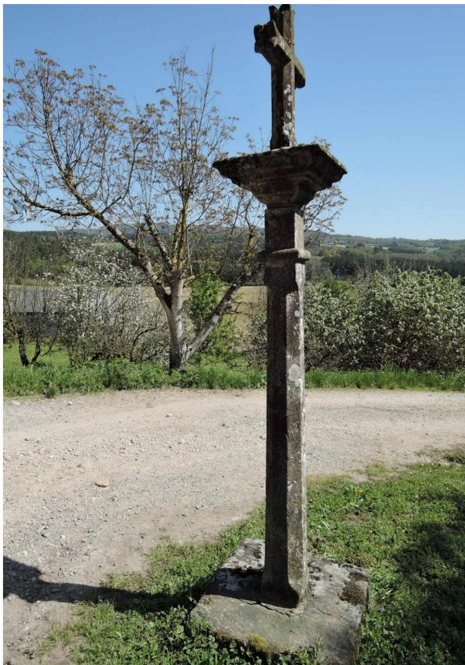
FOTO 4. SANTA MARIA DE GONDRAMA. CRUCEIRO.