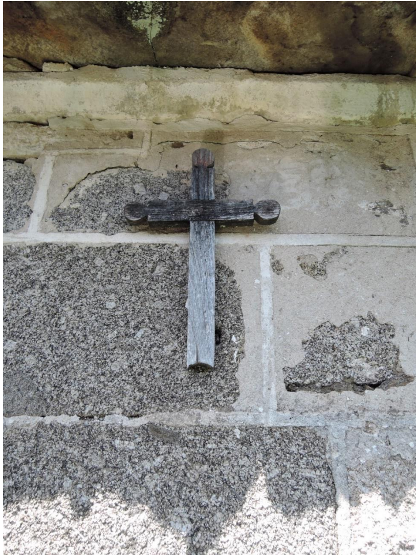
FOTO 1. ADAI. PAREDE LATERAL DA IGREXA. RESTOS DUN VIACRUCIS DE MADEIRA.