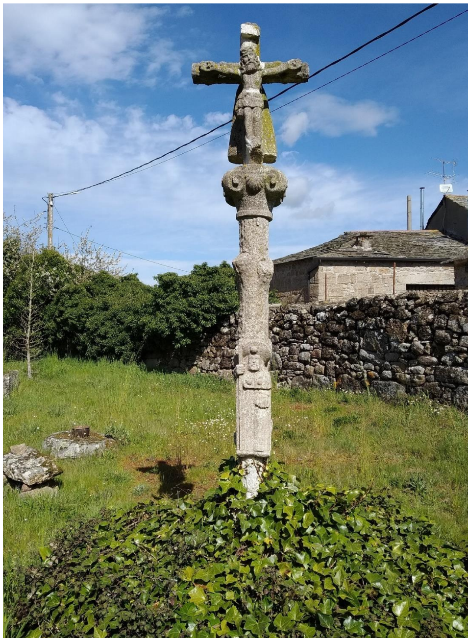
FOTO 20. CRUCEIRO DO PAZO.