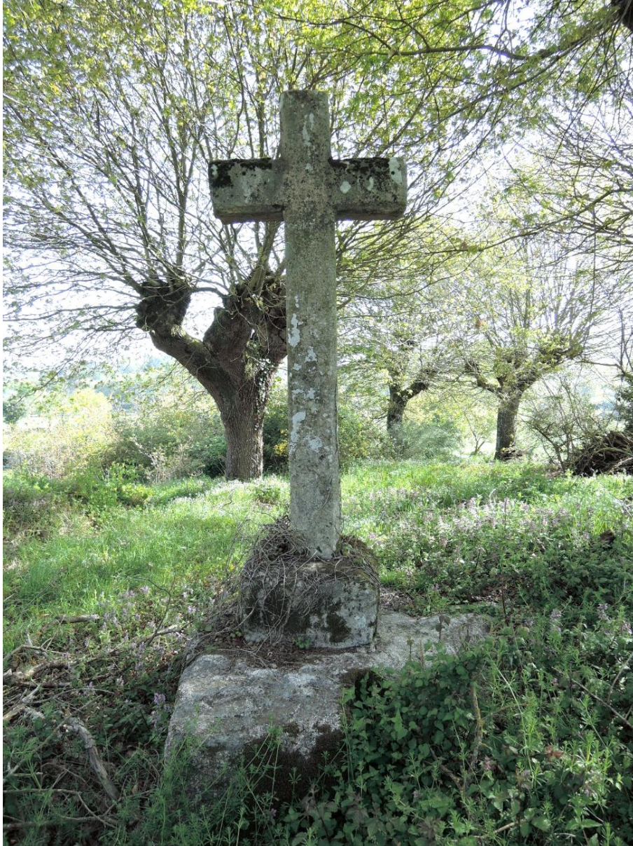
FOTO 16. SA. CRUZ DE ARMESTO.