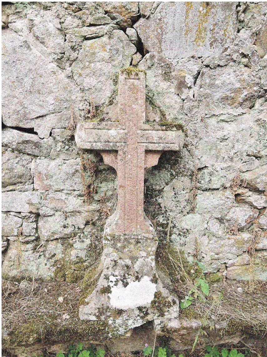
FOTO 11. MOSCÁN. CRUZ DO ADRO DA IGREXA