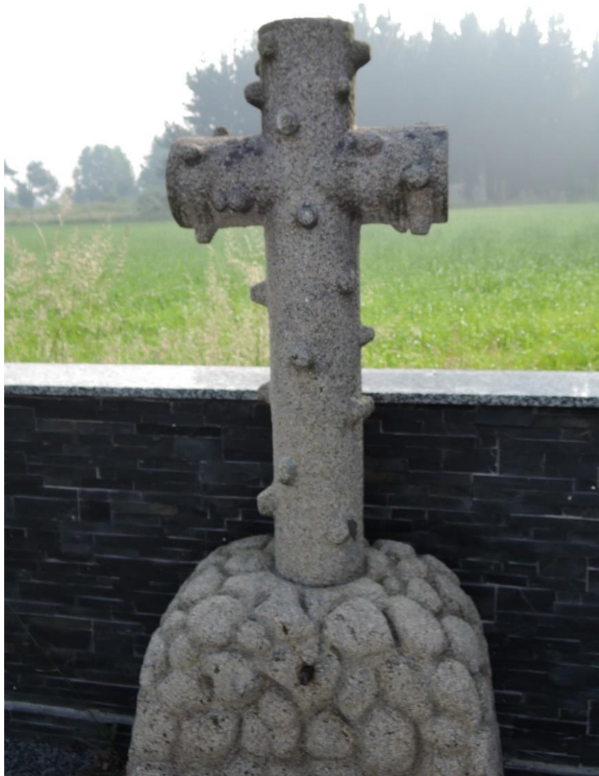
FOTO 13. MOSCÁN. CRUZ DO ADRO DA IGREXA