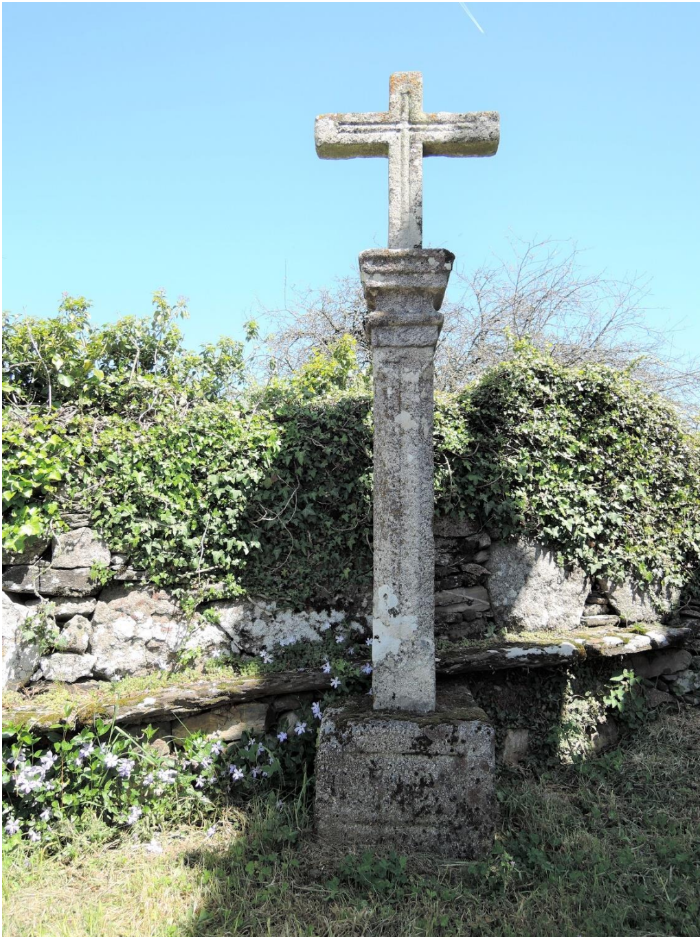
FOTO 22. SAN ANDRÉ DA RIBEIRA. CRUCEIRO DA ESQUERDA.