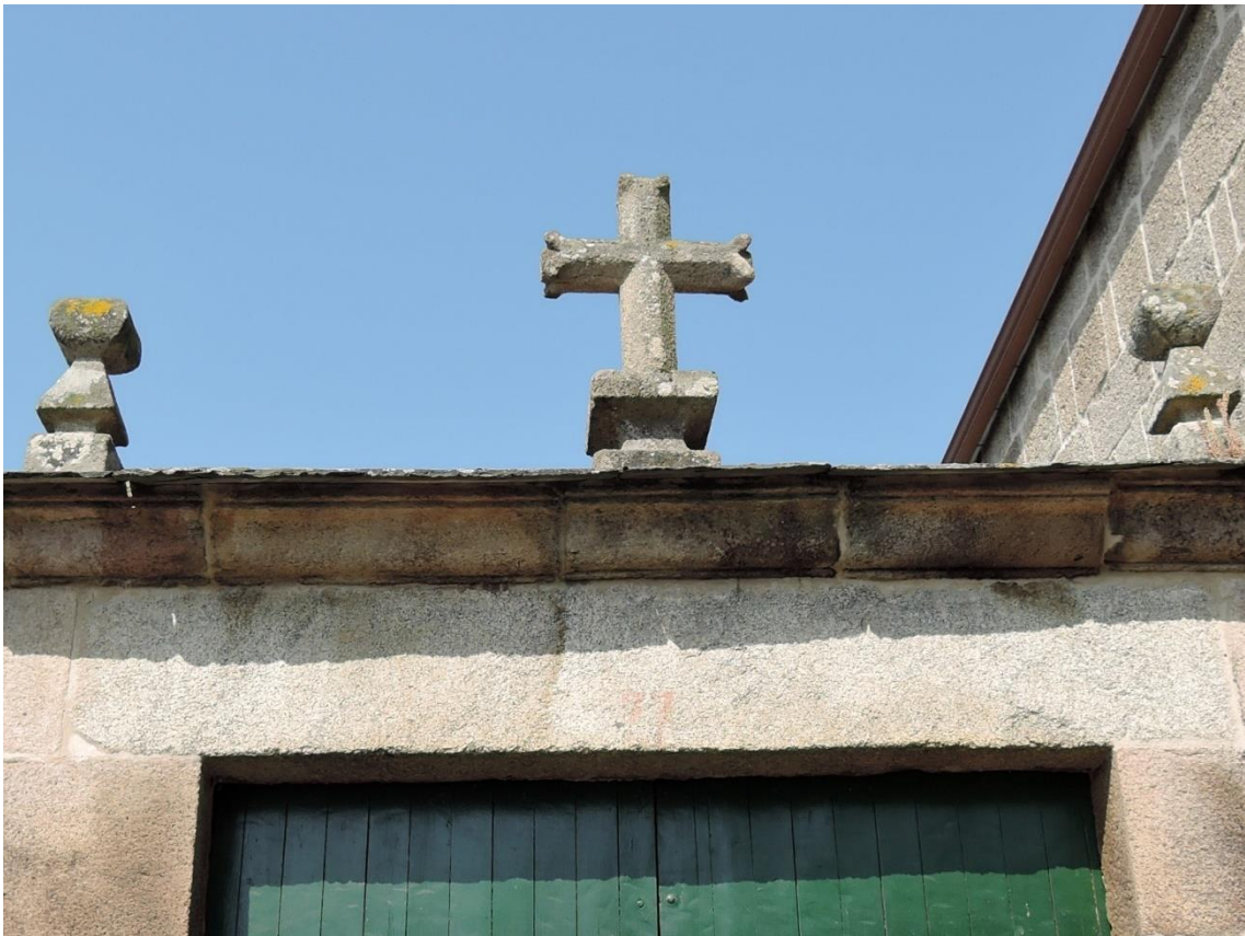
FOTO 14. NEIRA. CRUCEIRO DA ENTRADA AO PAZO.