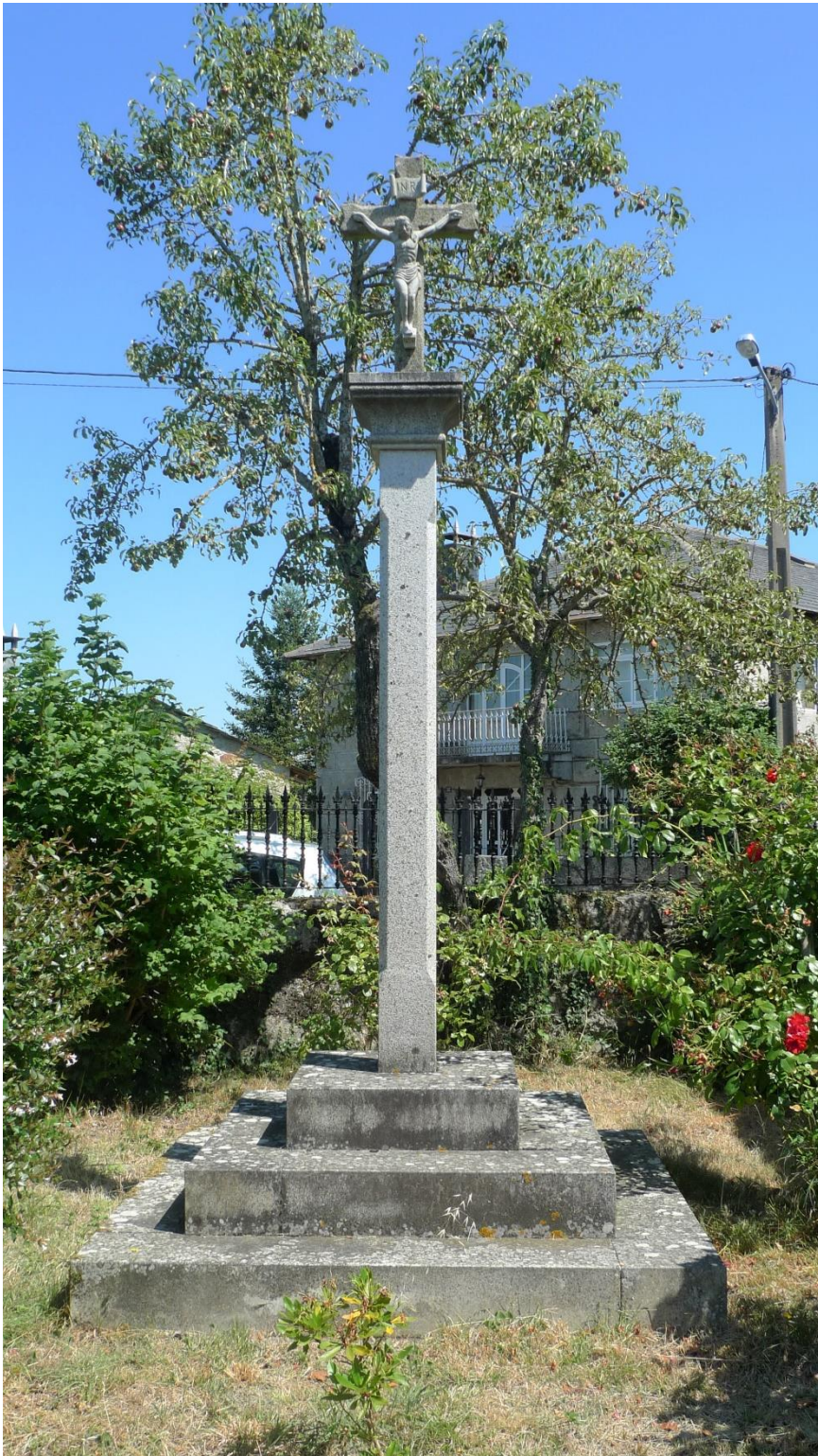
FOTO 23. A TORRE. CRUCEIRO DE SANTA COMBA