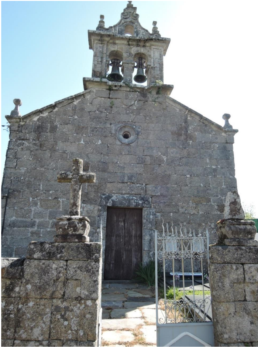
FOTO 25. VILARMOSTEIRO. RESTOS DUN VIACRUCIS.