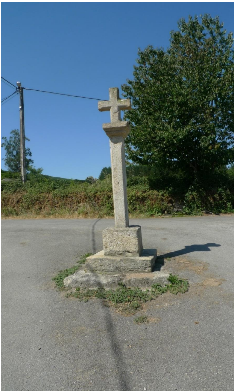
FOTO 17. SA. CRUCEIRO